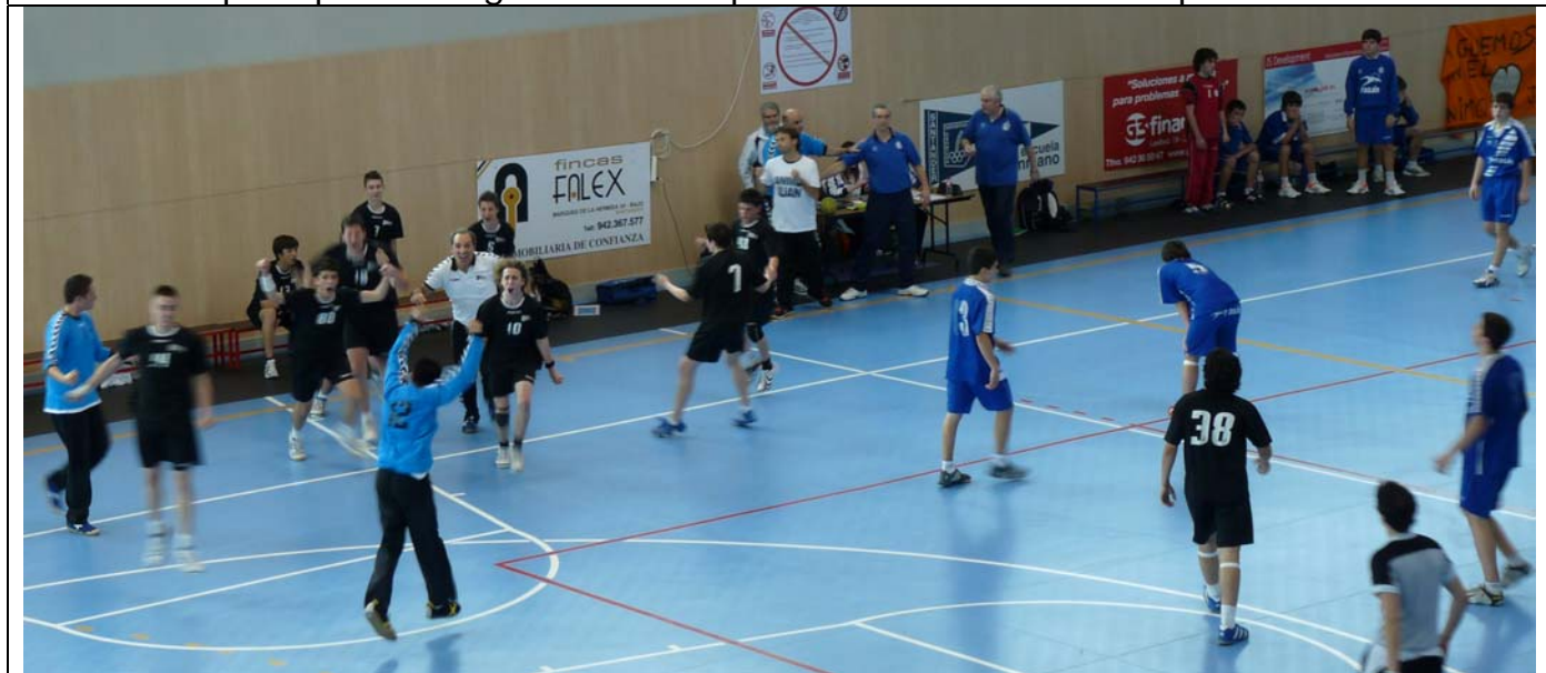
Sonrisas y Lagrimas: Dosa celebra su agónica victoria 35 – 34 ante un Arrate desconsolado