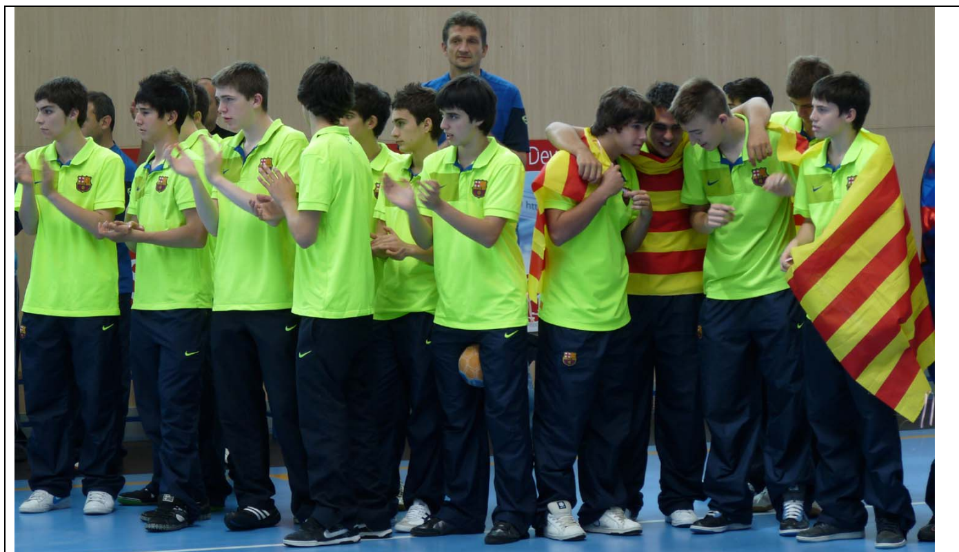
El Barsa espera para recoger el trofeo que le acredita como campeón del sector