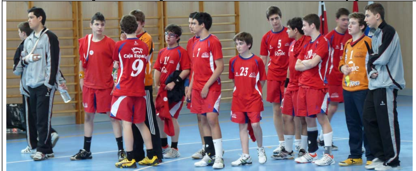
Maristas Ademar: Las lesiones mermaron notablemente su potencial.